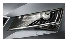
Smart Light Assist - automatické přepínání a clonění dálkových světel