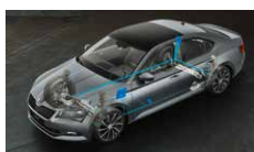
Adaptivní podvozek - volitelné nastavení podvozku ve 3 režimech (Comfort, Normal, Sport)

ŠKODA usnadňuje život svým zákazníkům každý den.