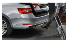
Virtuální pedál - bezdotykové otevírání 5. dveří